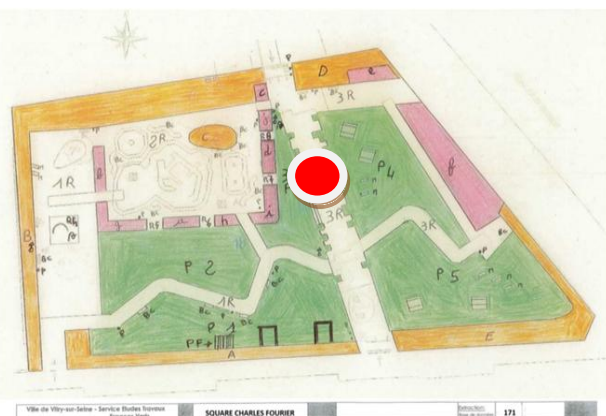
Photo de l'emplacement