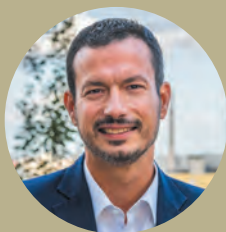
Pierre BELL-LLOCH, Maire de Vitry-sur-Seine

Le Grand forum, c'est le nouveau rendez-vous incontournable de la rentrée pour découvrir, d'un seul coup d'œil, ou presque, toute notre offre de services en matière de sport, d'éducation, de culture, de solidarité, de loisirs et plus encore.