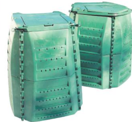
Composteur plastique 400L