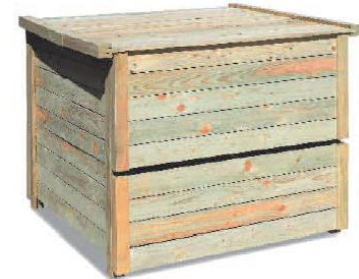
Composteur bois 400L