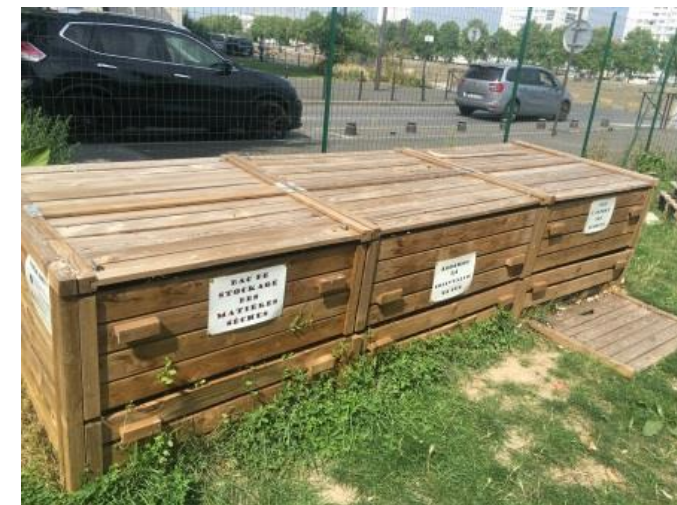
Site du compostage de quartier – Port-à-l'Anglais

✓ RÉDUIRE & PRÉVENIR □ COLLECTER □ VALORISER